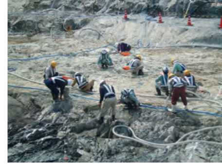
⑩ 堤体河床部仕上掘削(H25.4)