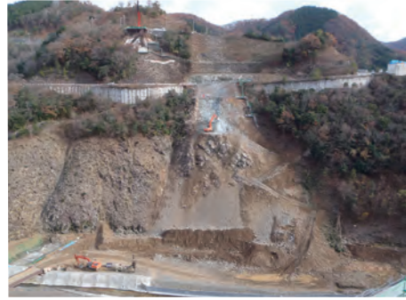
⑦ 堤体基礎掘削(左岸斜面部)(H24.11)