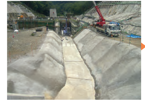
⑱ 二次転流施工状況(H25.7)