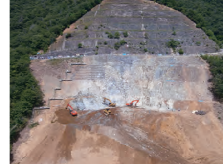
⑤ 堤体基礎掘削(右岸斜面部)(H24.7)