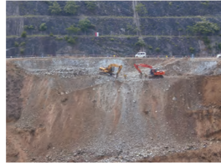
③ 基礎掘削開始(右岸側)(H24.5)