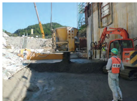
㉒ 堤体コンクリート打設状況(後行ブロック)(H25.9)