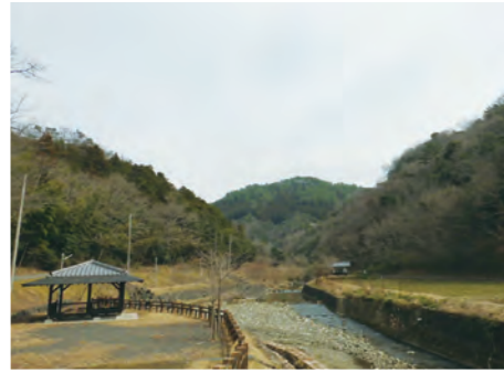
① 着工前下流より上流を望む(H24.3)