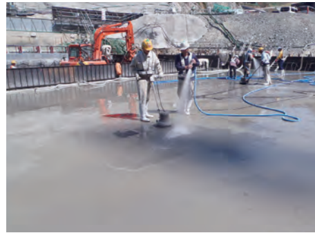
⑬ 水平打継面処理状況(H25.5)