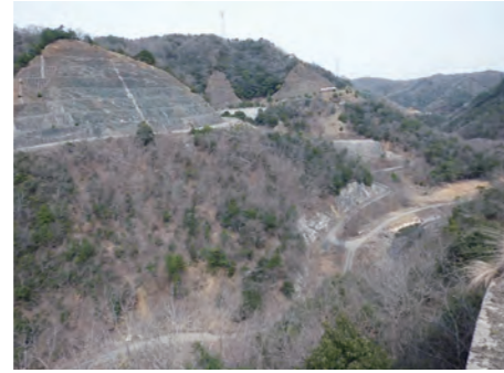
② 着工前左岸下流より下流を望む(H24.3)