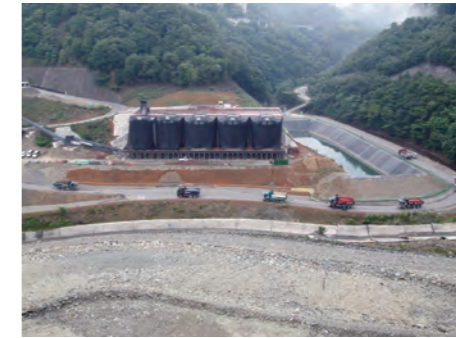
⑰ 購入骨材搬入状況(H25.7)