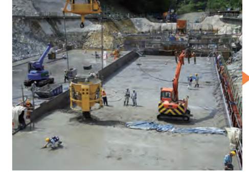
⑫ 堤体コンクリート打設状況(先行ブロック)(H25.6)