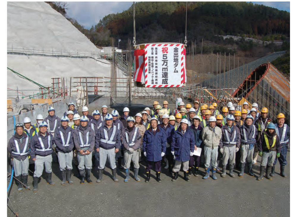
㉔ 5万m 3 達成(H26.1)