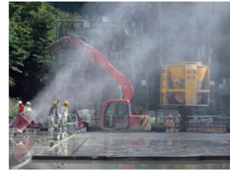
⑯ 暑中コンクリート打設状況(H25.7)